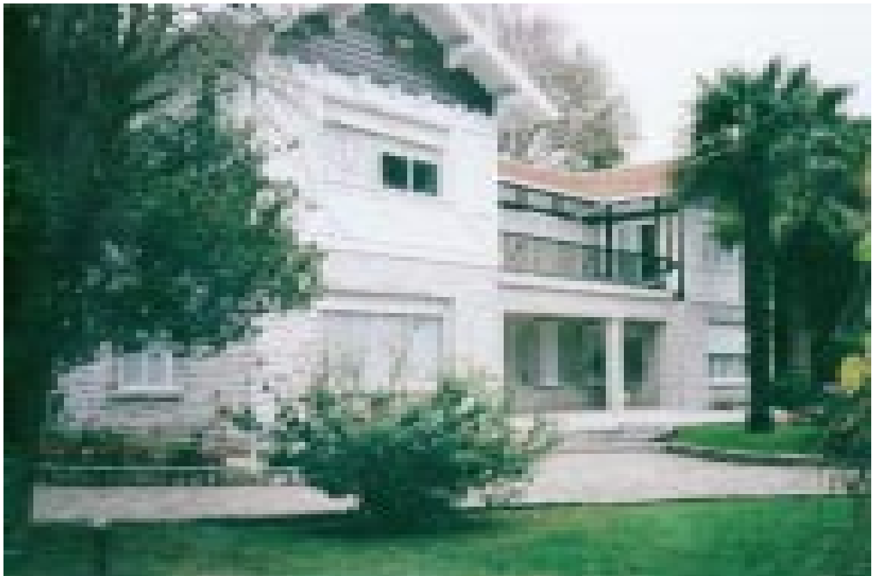
Nueva sede de Fundación Médica. Larrea 2640. Mar del Plata